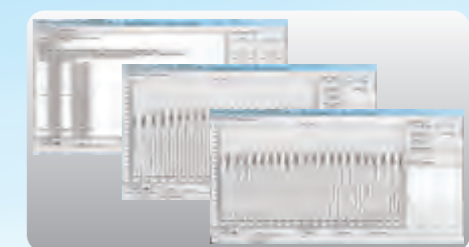
Software de Calibración