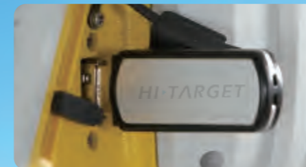
Almacenamiento de Datos