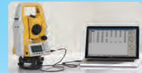
Software de Transferencia de Datos