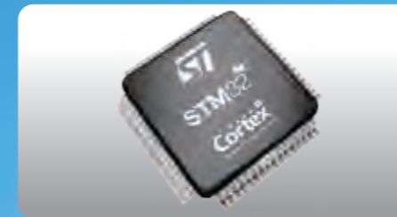
MCU de Alto Rendimiento