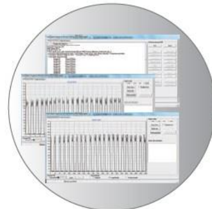
Software de Calibración