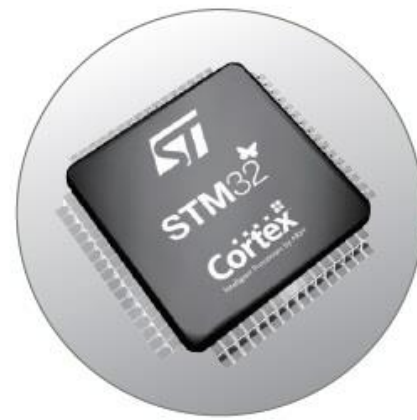
MCU de Alto Rendimiento

El software de transferencia de Hi-Target soporta diferentes tipos de formato de datos de salida, que se pueden usar en CivilCAD o software de postproceso de otras marcas.