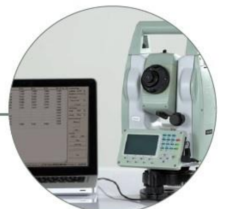
Software de Transferencia de Datos